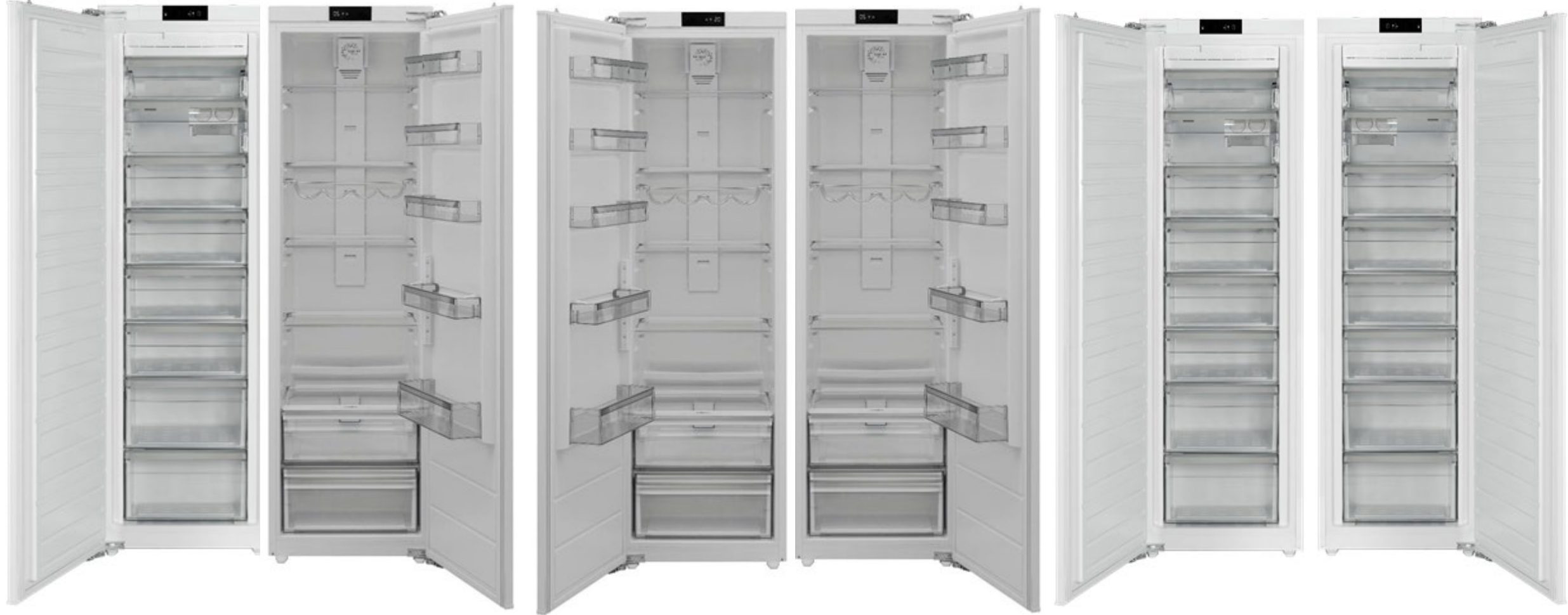
Объёмная морозильная камера